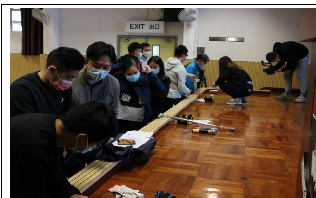
職業治療師到校培訓本校同工服侍長者技巧