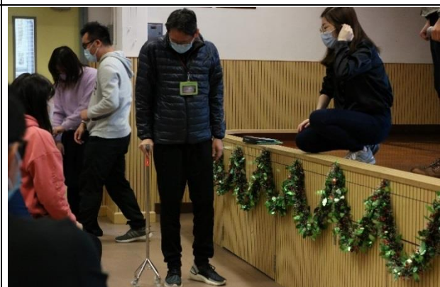
認真學習支援技巧