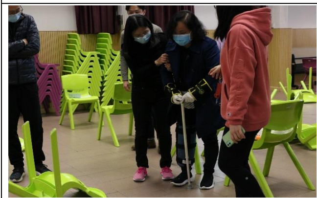
同時充當照顧者及長者