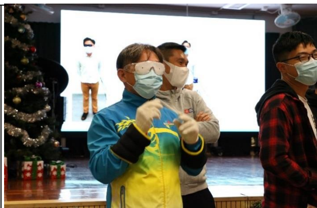
同事配戴各種工具以體驗長者生活的不便